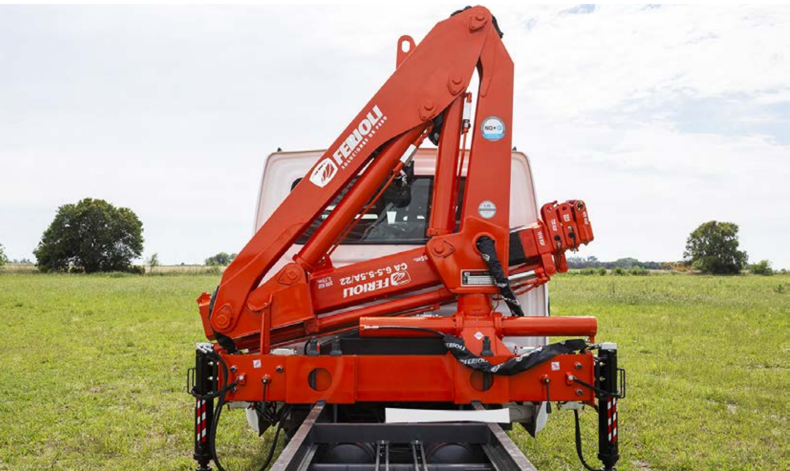
GRÚA VEHICULAR » CA 6.5 -5,5/22